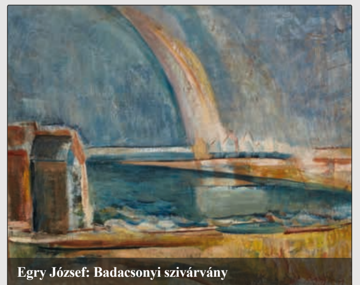
Egry József: Badacsonyi szivárvány

A műgyűjtő házaspárral készült riportunk a 8-9. oldalon olvasható. Martinovics