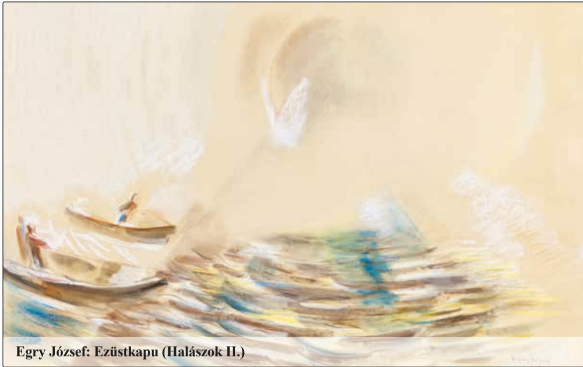
Egry József: Ezüstkapu (Halászkok II.)