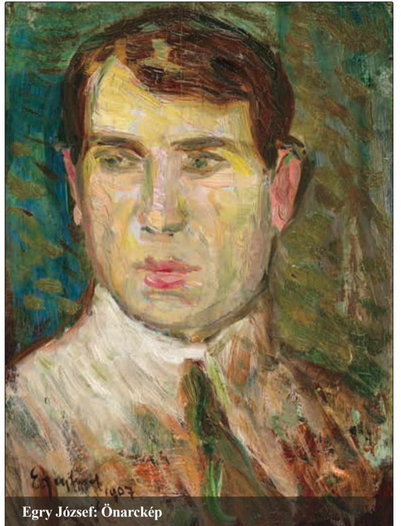
Egry József: Önarckép

Költő Magdolna: A munkássága második, tehát a Balaton festője korszakából származó képeinek az értéke egyértelműen magasabbak.