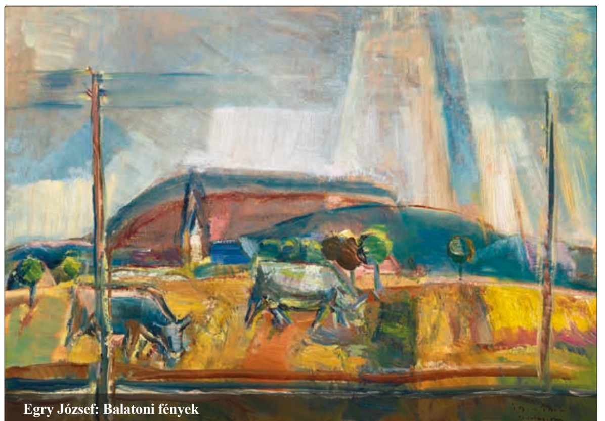
Egry József: Balatoni fények

Egry József – Lebegés a fénytérben című kiállítás június 21-éig látogatható a Vaszary Galériában.