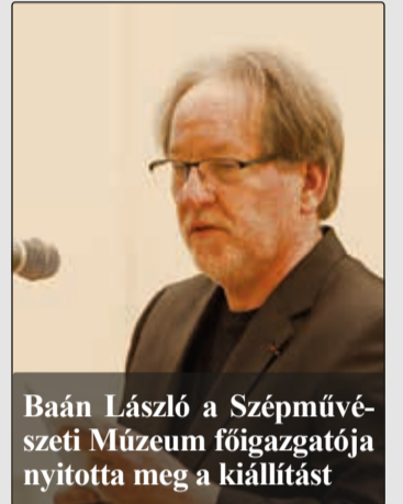
Baán László a Szépművészeti Múzeum főigazgatója nyitotta meg a kiállítást

Egry József életművét bemutató kiállítás nyílt a Vaszary Galériában. A több mint ötven képet felölelő tárlaton a Balaton festőjeként számon tartott alkotótól a jellegzetes technikával készült balatoni tájképei mellett a kevésbé ismert korai művek, karikatúrák, önarcképek is láthatók.