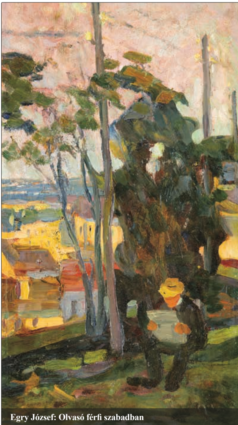
Egry József: Olvasó férfi szabadban