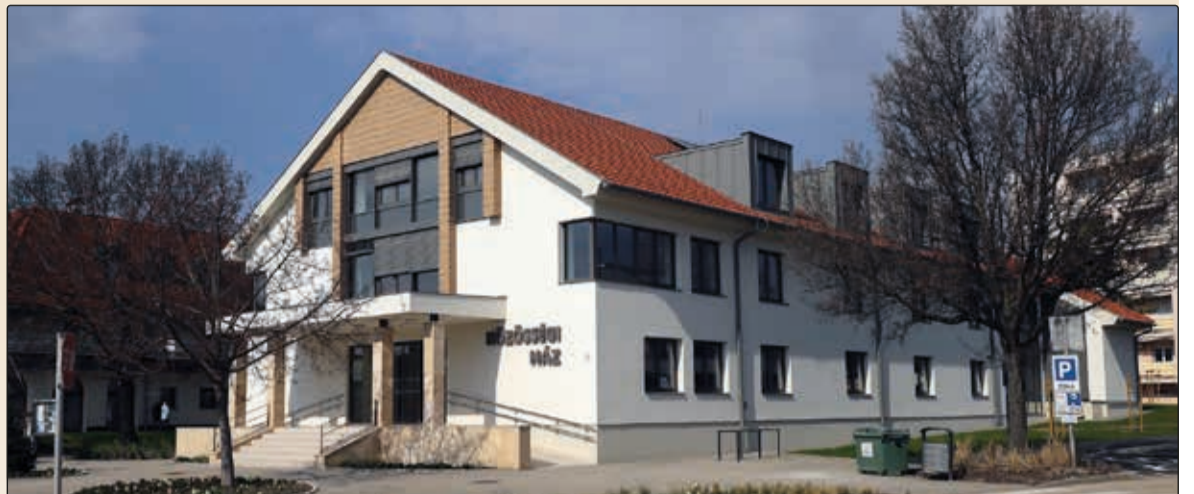
A projekt részeként a Községi Ház előtti csomópontban öszre körforgalom is épül