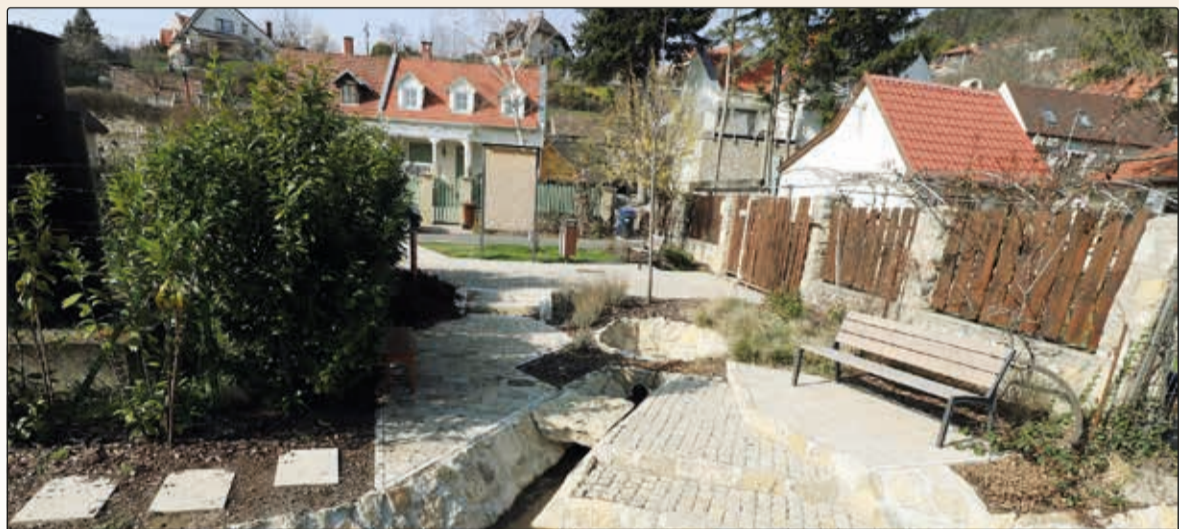
Balatonarács sem maradt ki a programból, a Béke utca és a Koloska utca közötti terület újult meg