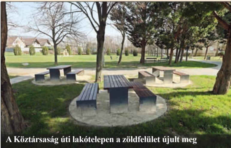
A Köztársaság úti lakótelepen a zöldfelület újult meg