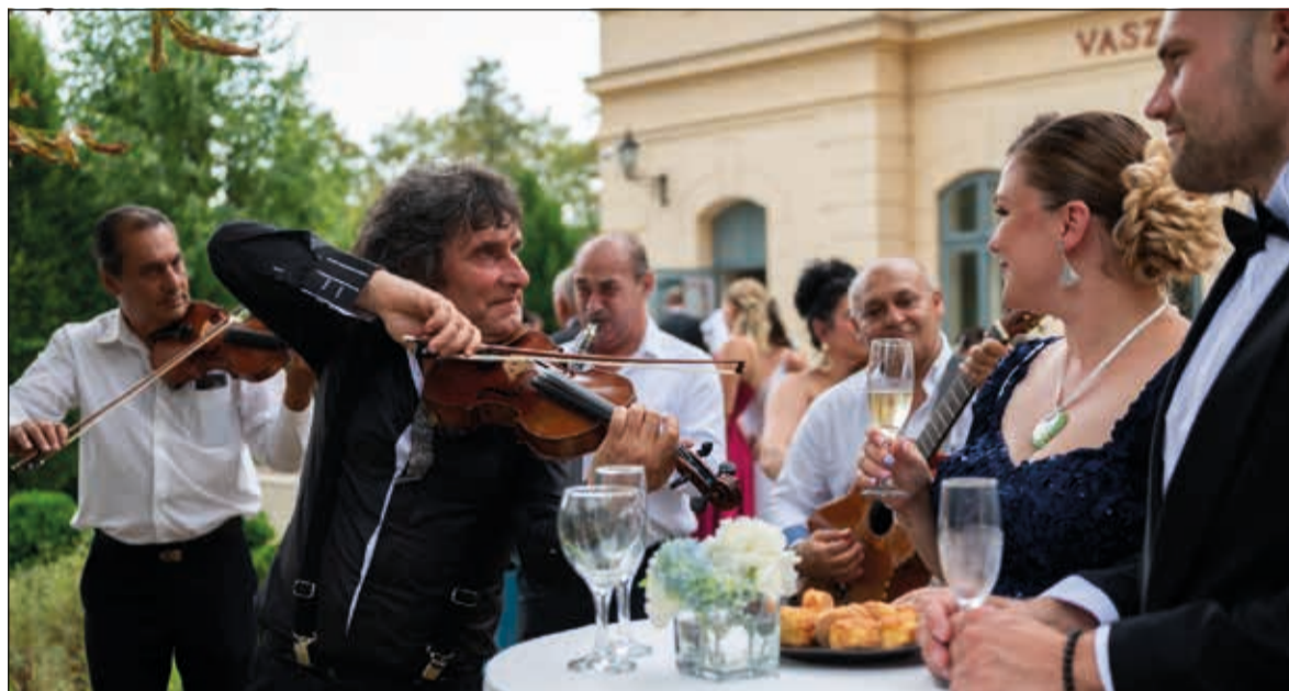
Az idei bált is élőben közvetíti a Füred Televízió a facebook oldalán

Július 29-én, a megújult Anna Grand Hotelben rendezik meg a 198. Anna-bált. A hamarosan bicentenáriumát ünneplő társasági eseményt az Anna Fesztivál kíséri. Lesz operaest, szívhálászat, prímás gála és újdonságként szerenádok éjszakája, amikor zenészek játszanak majd a reformkori városrész egyik erkélyéről a bálozó lányoknak.