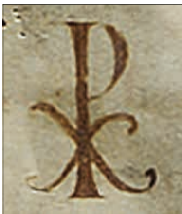
A Tihanyi alapítólevél Krisztus-monogramja

A legismertebb magyar szavak a latin nyelvű oklevélben: bolatin (Balaton), fuk (fok), tichon (Tihany), feheruuaru rea meneh hodu utu rea (Fehérvárra menő hadi útra), amelyek a nyelvtörténet számára is meghatározóak a 11. századból.