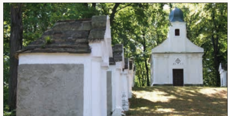
A városlódi kálvária első térképes jelölése 1784-ből való