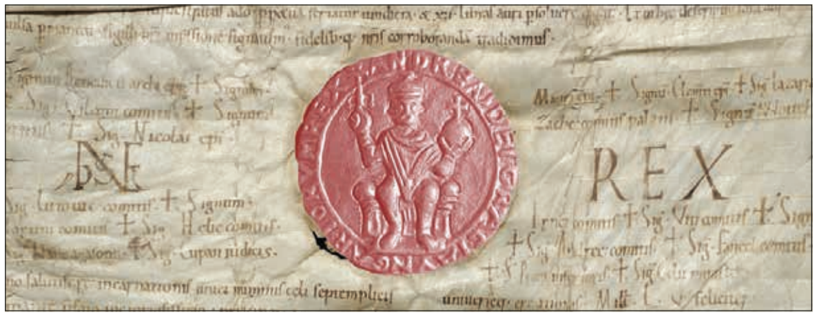
Rekonstruált pecsét a Tihanyi alapítólevélen (Az elveszett királyi pecsét helyett az idézőpecséttel)

A latinul íródott, de magyar szavakat is tartalmazó oklevelet a király ellátta kézjeggyel.