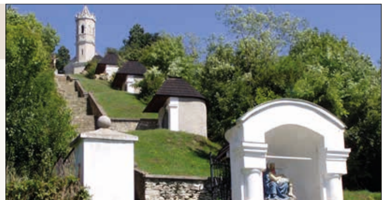
A magyarpolányi kálvária öt kápolnaszerű stációból áll

További információ elérhető a viacalvaria.hu oldalon. BFN