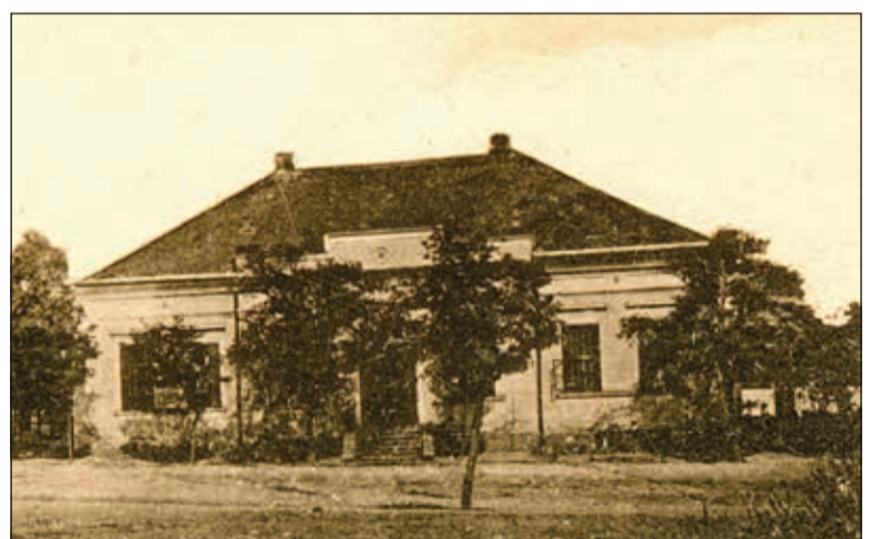
A balatonfüredi járási bíróság épülete (1872-1956)