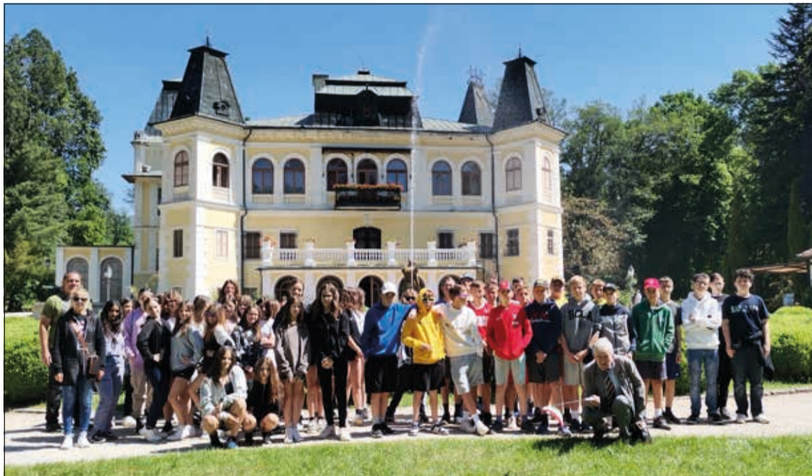
Csoportkép a betléri Andrassy-kastély előtt

2023.05.30 - 06.03. között a Balatonfüredi Radnóti Miklós Általános Iskola 48 hetedik osztályos tanulója és négy kísérő tanára vett részt a Határtalanul program keretében a Mátyás király nyomában, várak és városok a Felvidéken kiránduláson. Ez idő alatt az évfolyam nemcsak a Felvidékről és a magyar királyokról tudhatott meg többet, hanem a mai Szlovákiát is jobban megismerhette.